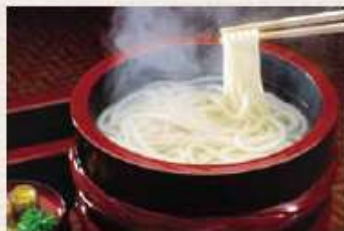
〈香川県〉さめきうどん

近年、数軒のうどん店をハシゴする「さめきうどん祭り」がブームとなり、香川県外から大勢の観光客が訪れています。店によって味や食べ方も様々で、その違いを楽しむことが「さめきうどん祭り」の醍醐味です。