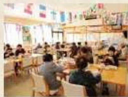
町民サービスセンター

社会福祉協議会をはじめ、多数の社会福祉法人があり、高齢者福祉、障がい者福祉、児童福祉等、様々な分野で、地域福祉の実践に向けた取り組みが行われています。