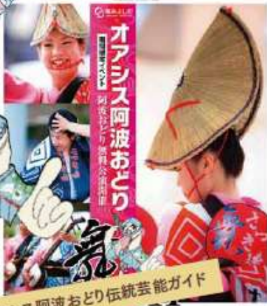
オアシス阿波おどり伝統芸能ガイド