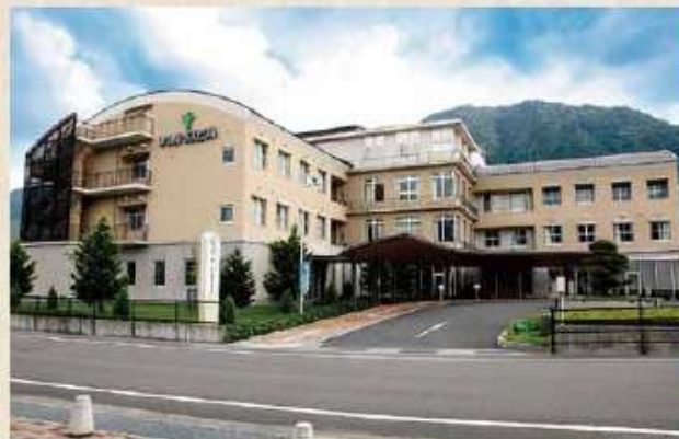
ひがしみよし総合病院