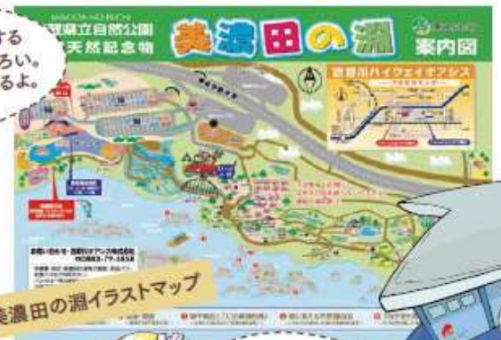
美濃田の淵イラストマップ