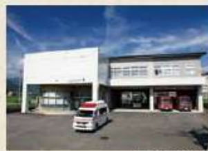
みよし広域連合消防本部