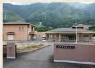
公営上下水道大町浄水場

さらに、母子生活支援施設「みかもハイツ」もあり、母子家庭の自立促進、相談等の支援も行っていきます。