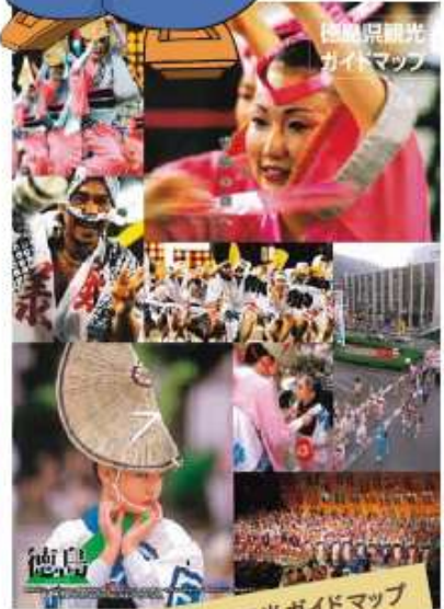
徳島県観光ガイドマップ