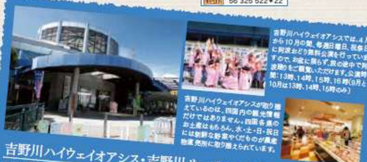
吉野川ハイウェイオアシス・吉野川サービスエリア

冬場にはLEDの光のトンネルで彩られる「オアシス横」で吉野川ハイウェイオアシスと結ばれている吉野川サービスエリアは、日本経済新聞に掲載された「家族で楽しめるSA・PA」の西日本編第5位に選ばれました。吉野川ハイウェイオアシスからは県の名産・天然記念物に指定されている美濃田の潮を散策いただけるほか、物産センターには、ここでしか味わうことのできないすだちソフトや「いもアイス」といったスイーツもあり、旅の途中で車を止めたまま家族で楽しんでいただけます。