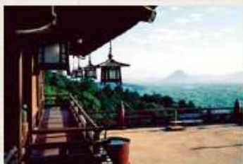
〈香川県〉金刀比羅宮

一生に一度はお参りしたいと言われる、今も多くの参拝者が絶えない「さめきのこんびらさん」で知られる金刀比羅宮。高灯籠や鶴橋など、旧街道の名残を感じる参道には、数多くのみやげ物店が軒を連ねています。