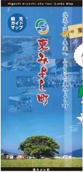
東みよし町観光ガイドマップ