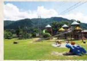
新野川ハイウェイオアシス ふれあいの広場

町内にはJR四国の駅が3つあり、特に主要な役割を果たしている阿波加茂駅には無料の駐車場や駐輪場(150台収容可)も整備されています。また、路線バスも町営バスと民間バスが運行しており、共に高校生の通学や通勤などによく利用されています。