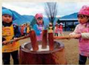
みよし広域連合保育所

それに加え、地域に密着した消防団・自主防災組織が形成されており、火災予防の啓発や、消防団法大会などの訓練を通して、技術を磨いています。人とのつながり、安全なまわりの効果的な伝統ある組織です。また、「防災マップ」を作成して、日頃からの防災意識の向上を目指しています。