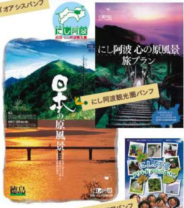
にし阿波観光圏パンフ