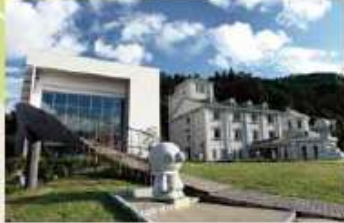
〈高知県〉アンパンマンミュージアム

アンパンマンの原画を展示するギャラリーなどがあるアンパンマンミュージアムと、企画展などを行う館とメルヘン絵本館からなるアンパンマンミュージアム。子どもだけでなく大人も楽しめる、家族旅行におすすめの観光スポットです。