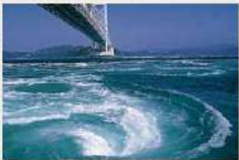
〈徳島県〉鳴門のうず潮

瀬戸内海と紀伊水道の潮の干満と、海底の複雑な地形によって生まれる大小さまざまなうず。徳島県立渦の運は、大渦門構の構内に設けられた展望遊歩道の床からうず潮を見下ろすことのできる、とびきりの観潮スポットとなっています。