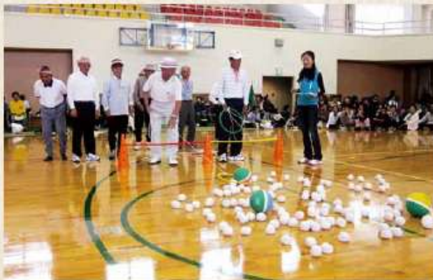
老人クラブ運動会