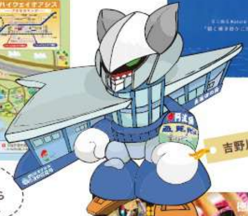
吉野川ハイウェイオアシスパンフ