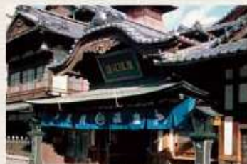
〈愛媛県〉道後温泉本館

愛媛一の観光名所。木造三層様の道後温泉本館は国の重要文化財ですが、現役の公衆浴場として利用され、毎日多くの人浴客で賑わっています。