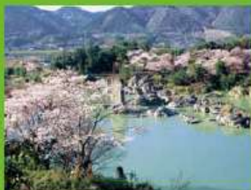
県立善蔵自然公園 美濃田の淵

四季折々の美しい自然と神秘的な奇岩、怪岩がお出迎へ。吉野川中流域唯一の自然遊楽の地として、昔から静寂に誘われ、絵筆に描かれてきた筑前県の名勝・天然記念物に指定の「美濃田の淵」。壱岐島の水面には「獅子岩」「鮎釣岩」「作造岩」などと名付けられた奇岩、怪岩がぽっかりと浮かび、神秘的な趣をたえています。長さ2km、幅100mにわたる深い淵は四季折々の美しい花や木々に囲まれ、川面には鮎が舞います。