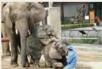
〈愛媛県〉とべ動物園

世界各地の動物を自然に近い姿で観覧できます。動物とのふれあいやエサやりも楽しめます。しるくまピースやアフリカゾウの家族(国内でココだけ)に出会うことができます。