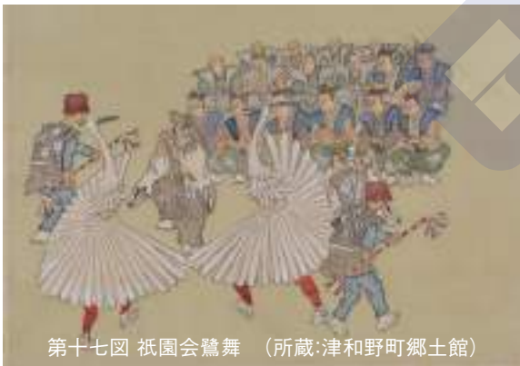
第十七図 祇園会鷺舞

世界の絵本作家・安野光雅氏は現在も精力的に作品を生み、町にある美術館で多くの人を楽しませています。