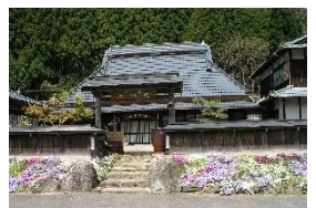
古民家の宿 木治屋