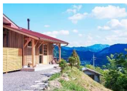
森のオーベルジュ星咲～きらら～