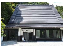
そに木霊リゾート埵～TAWA～