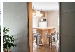
SONI GATE 山粕宿