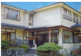
民宿 2, 7 (ツーセブン)