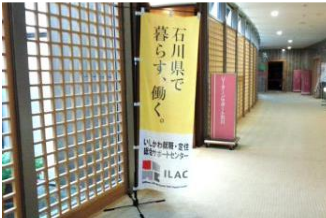
▲この黄色いのぼり旗が目印です！