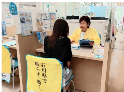
※センター相談風景